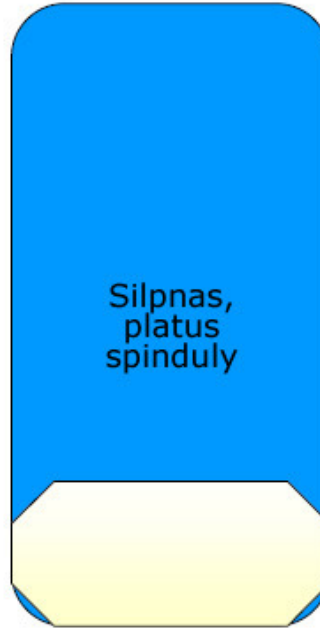
LED lempa iš dešimčių ar šimtų papastų 0,06 W LED'ukų